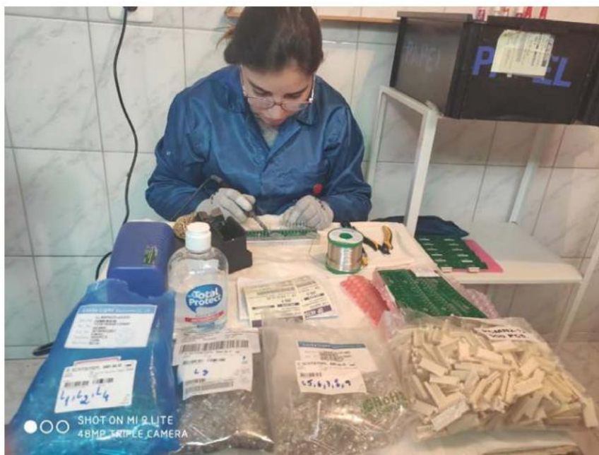
Schmersal adotou projeto piloto de produção na casa de colaboradores de pequenas chaves e sensores

Nesse projeto piloto, estão contemplados os montadores da área de eletrônica da Schmersal, atividade usualmente realizada em um ambiente fechado e com maior proximidade entre os colaboradores. “Por serem produtos da área de eletrônica, apenas tivemos que escolher itens que não precisam de cuidados com a eletrostática - requisito básico para montadores de eletrônica. Dessa forma, estamos montando